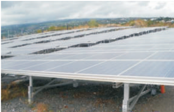
Figuur 1: Foto van 'n fotovoltaïese sonkragaanleg

Die FV-panele is ontwerp om vir meer as 20 jaar ononderbroke, onbeman en met min instandhouding te funksioneer.