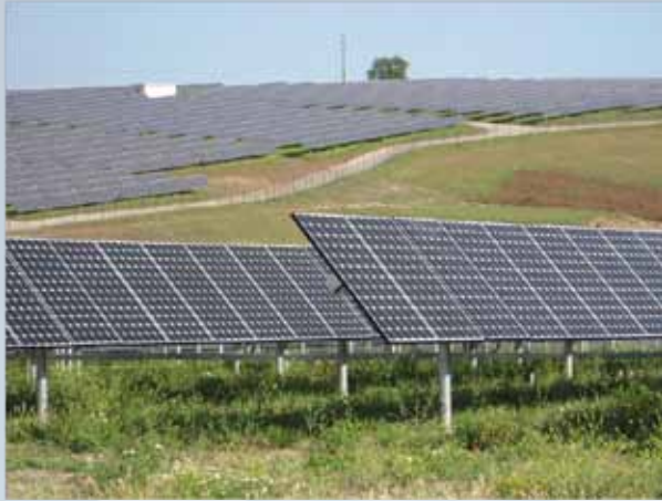
Illustrasie van 'n fotovoltaïese sonkragaanleg

Die FV-panele is ontwerp om vir meer as 20 jaar ononderbroke, onbeman en met min instandhouding te funksioneer.