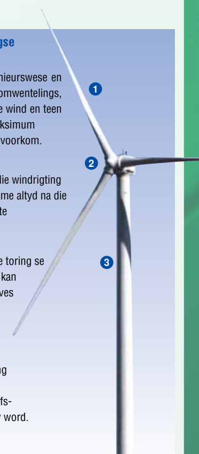
Figuur 1: Illustrasie van die hoofonderdele van 'n windturbine

4 Die moniteringstelsel meet en teken die turbine se werkverrigting aan deur uitset te meet, enige ondoeltreffendheid uit te lig en enige werk aan te dui wat benodig word. Dit is per rekenaar aan die Bedryfs- en Onderhoudsdepartement gekoppel en toegang kan indirek verkry word.